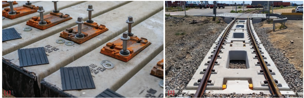
[1] Traverses béton pré-montées. [2] Voie sur dalle développée avec Sysra.

Résultat du rachat de Stradal Ferroviaire par le groupe Baret, B-Rail a déjà équipé 1/4 du réseau français dont 1/3 des lignes à grande vitesse